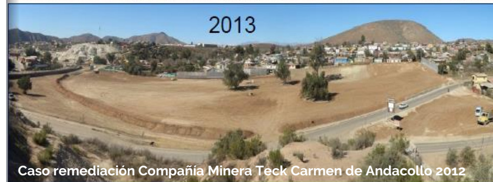
Caso remediación Compañía Minera Teck Carmen de Andacollo 2012