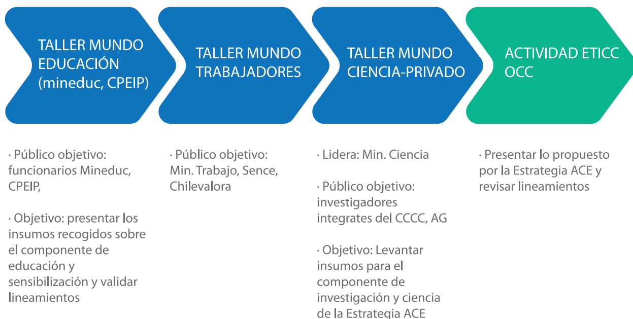
Figura 3. Actividades de participación con públicos específicos desarrolladas en 2021

La información recopilada ha sido enormemente rica desde todos los puntos de vista de diagnóstico, análisis, propuestas, acciones, etc...También ha permitido el conocimiento de las actitudes, disposiciones éticas o emociones que suscita la percepción del cambio climático y sus consecuencias en Chile. En este documento se sintetizan solo los aspectos más relevantes, por lo que en el caso de que se quiera ampliar o encontrar más detalle, se recomienda acudir a la web de cambio climático del MMA donde se encontrará más información, donde se podrán consultar los informes que contienen la sistematización completa de estas y otras actividades.