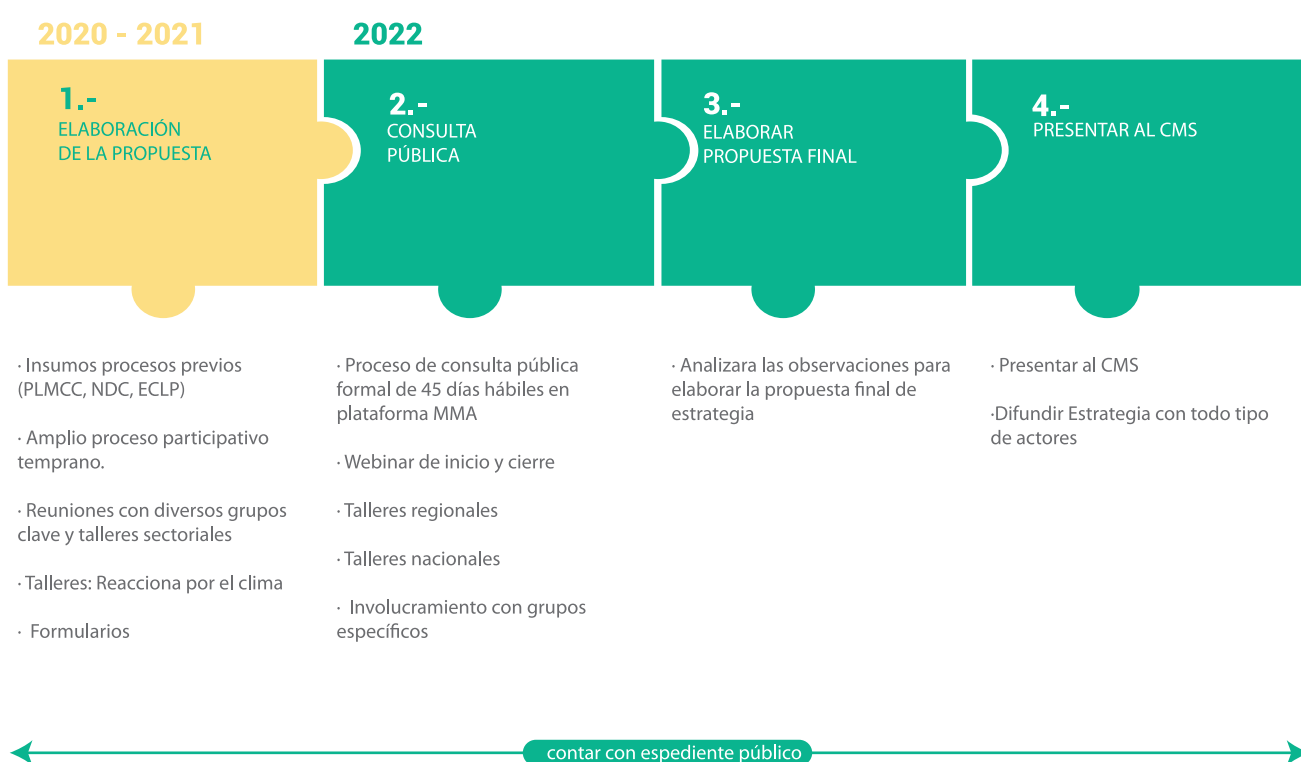
Figura 1. Etapas para elaborar la Estrategia de Capacidades y Empoderamiento Climático