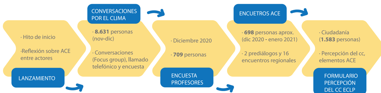
Figura 2. Actividades de participación desarrolladas entre octubre 2020 y enero 2021.

Previamente, se habían organizado bajo el contexto del programa ciudadano ReAcciona por el Clima diversas actividades con especial atención en ACE, como lo fueron las Conversaciones por el Clima que habían involucrado a 8.631 personas y una encuesta en la que participaron 709 personas del ámbito docente. Además, como parte del plan comunicacional de la ECLP de Chile también apoyado por el programa Euroclima+ a través de FIIAPP se implementaron tres cuestionarios web sobre percepción del cambio climático y sobre la Estrategia ACE. El proceso completo se recoge en el siguiente esquema.