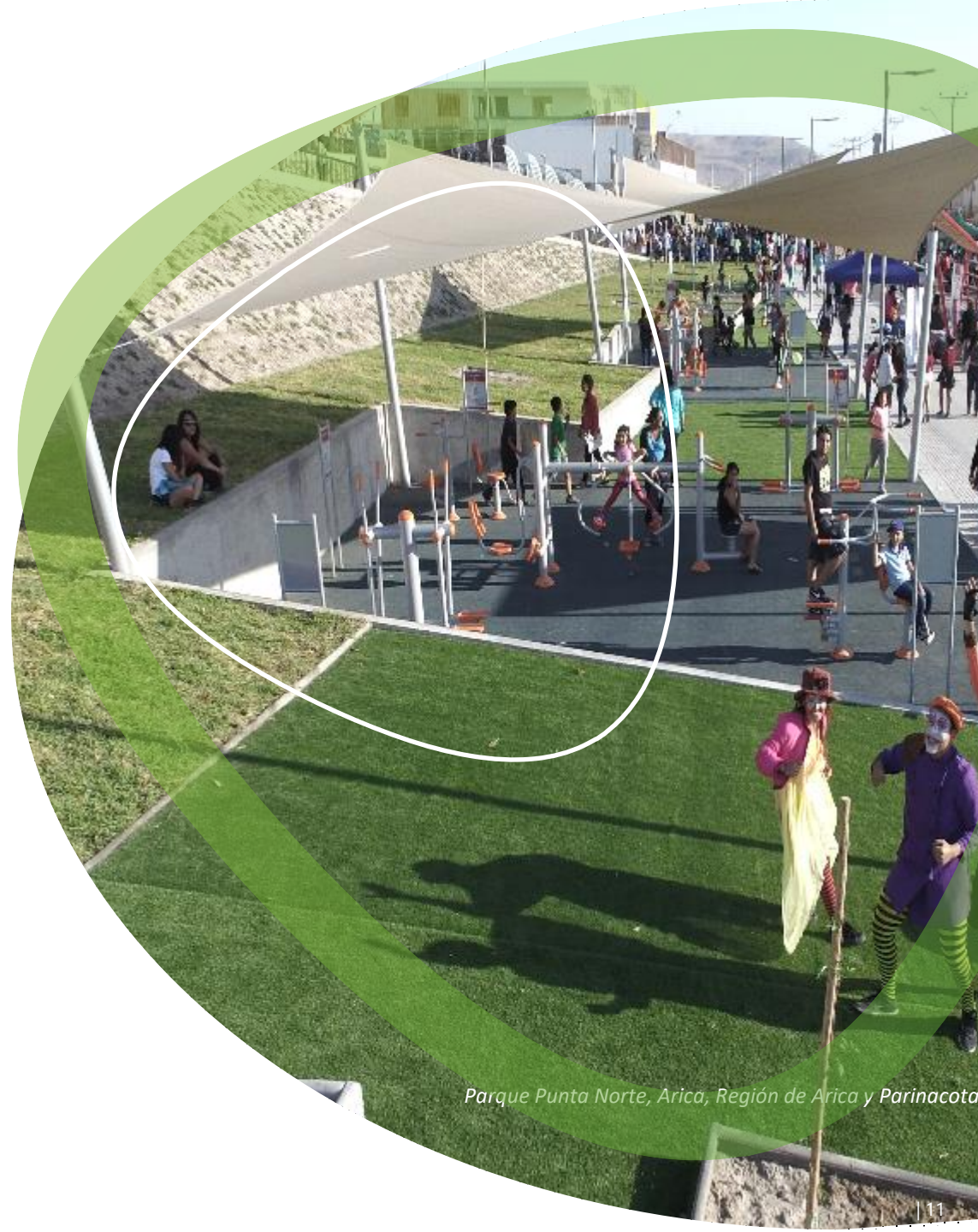
Parque Punta Norte, Arica, Región de Arica y Parinacota

Generar un marco consensuado a nivel nacional para orientar y promover el desarrollo de parques urbanos sostenibles, que se constituyan como uno de los componentes estructurantes de la planificación de las ciudades y territorios, que promuevan la equidad territorial y la integración social, fortalezcan la pertinencia e identidad, aporten al bienestar, la salud y la seguridad de las personas, contribuyan al desarrollo local y al equilibrio ambiental, a través de una gestión integrada, descentralizada y participativa.