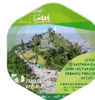
2 CONSULTAS CIUDADANAS