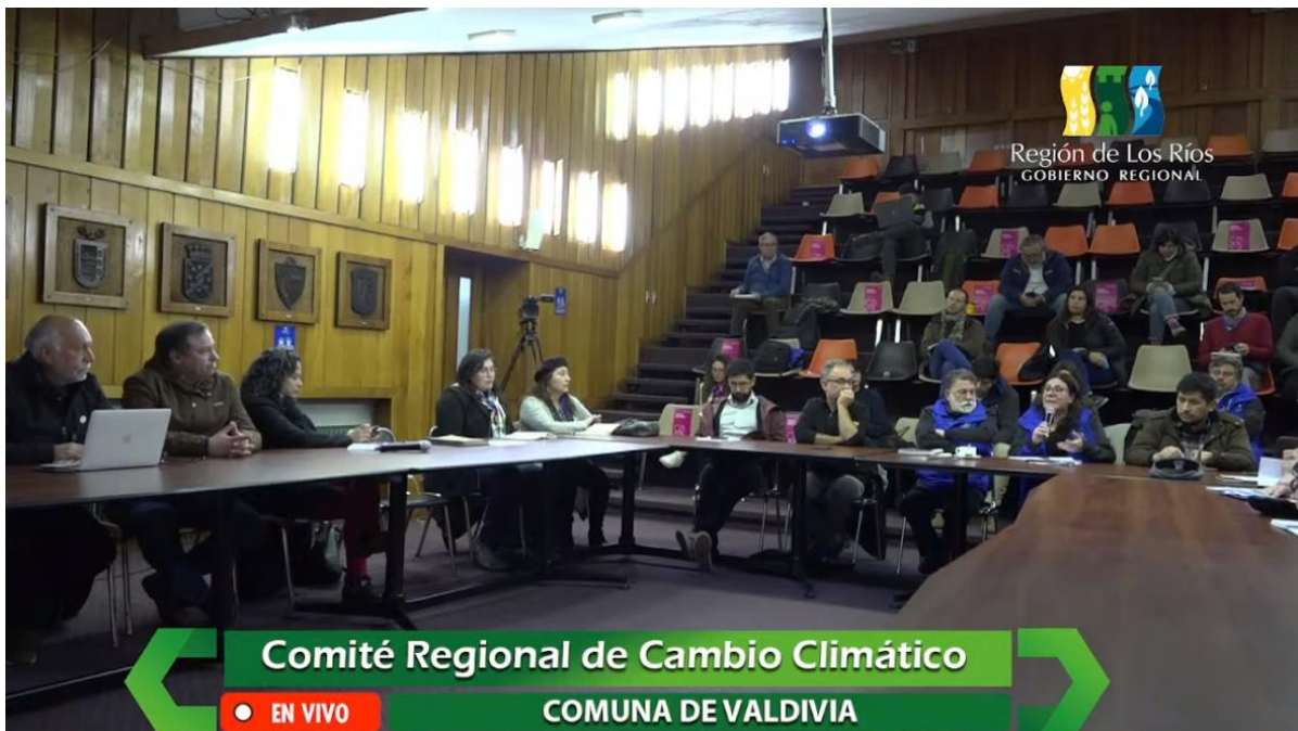
Fuente: Transmisión YouTube, 02 de mayo de 2024.