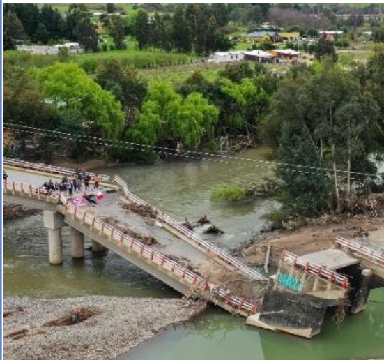
Reposición de puente Maitenhuapi Región del Maule

Adecuar los servicios que prestan la infraestructura y edificación pública a los impactos del cambio climático, para que sean resilientes al clima actual y futuro.