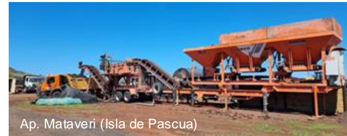
Ap. Mataverí (Isla de Pascua)

Menor volumen de áridos nuevos (hasta -76%)