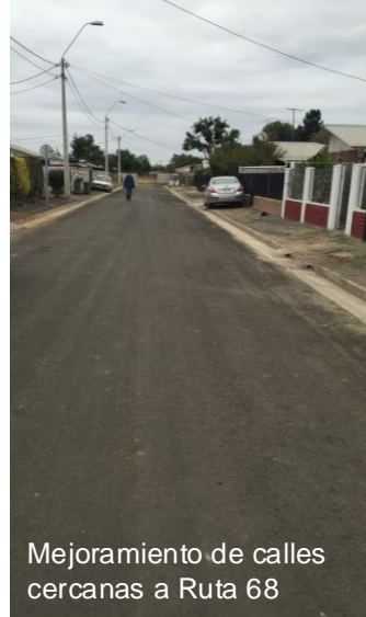
Mejoramiento de calles cercanas a Ruta 68