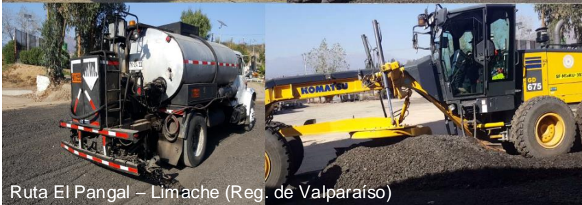
Ruta El Pangal – Limache (Reg. de Valparaíso)