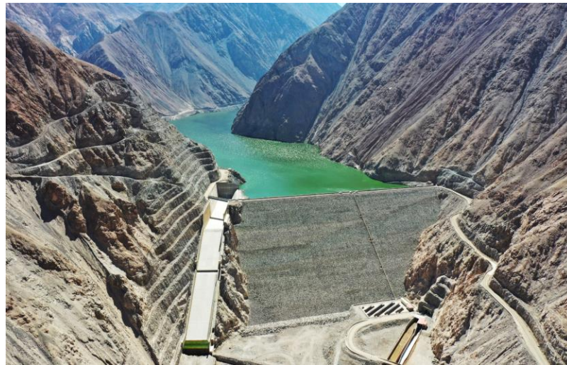
Embalse Chironta Región de Arica y Parinacota