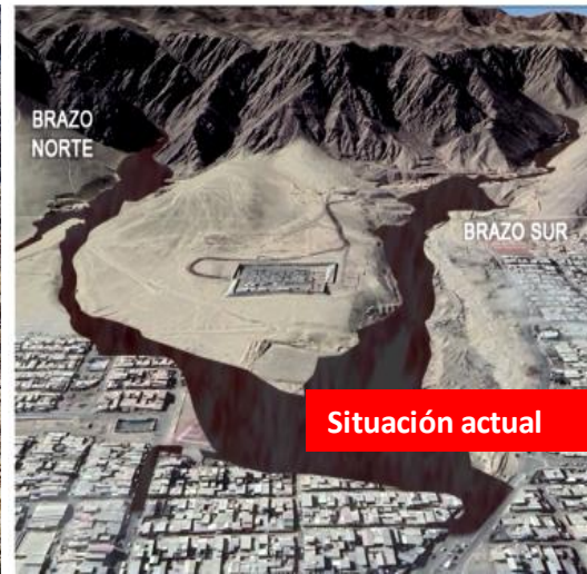
Obras de control aluvional en Quebrada Bonilla Región Antofagasta