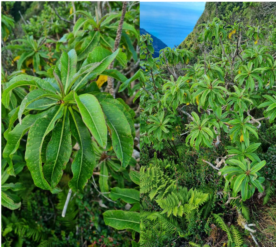
Dendroseris micrantha , sector El Camote, Isla Robinson Crusoe. (Fotografías: Ignacio Ibáñez).