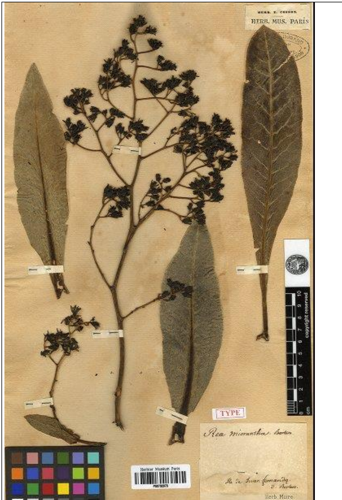
Muestra de herbario de Dendroseris micrantha : Material Tipo (P00732973) colectado por Carlo Bertero en 1830 en Robinson Crusoe, actualmente depositado en el herbario del Muséum National d'Histoire Naturelle (P).