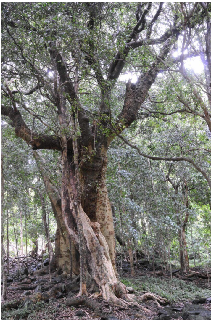
Fagara mayu , en la mirtisilva de Robinson Crusoe.