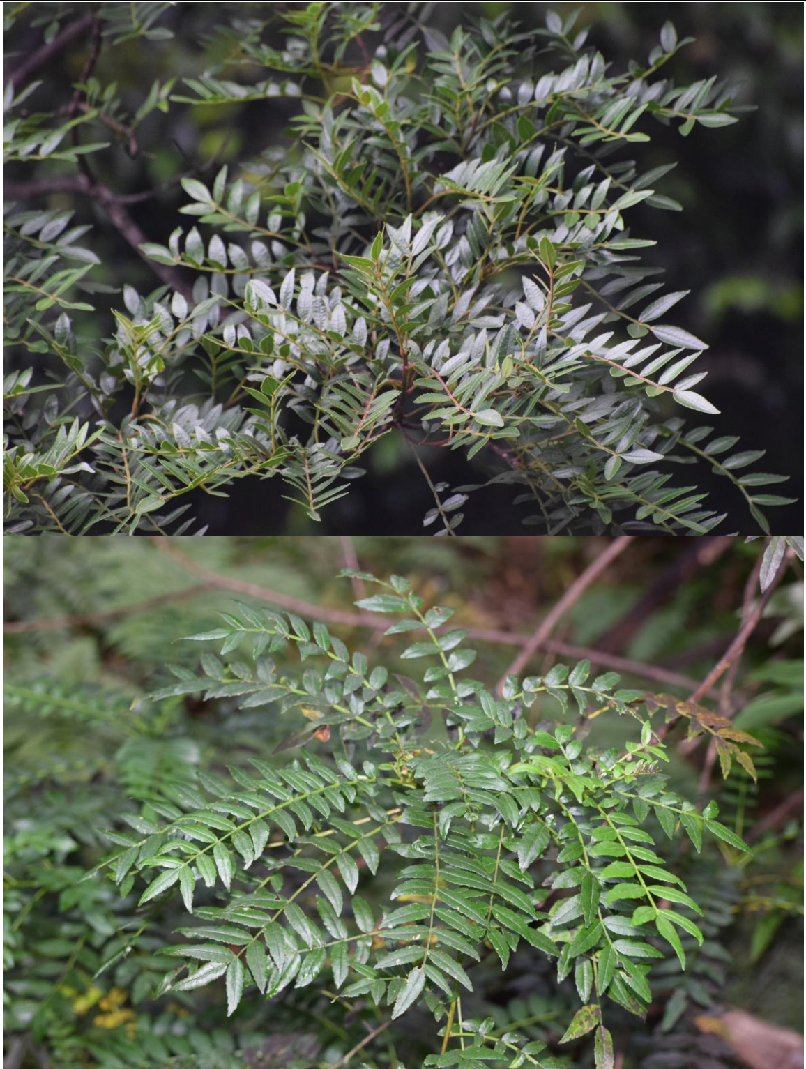
Fagara mayu , detalle de las hojas (Fotografía: Héctor Gutiérrez).