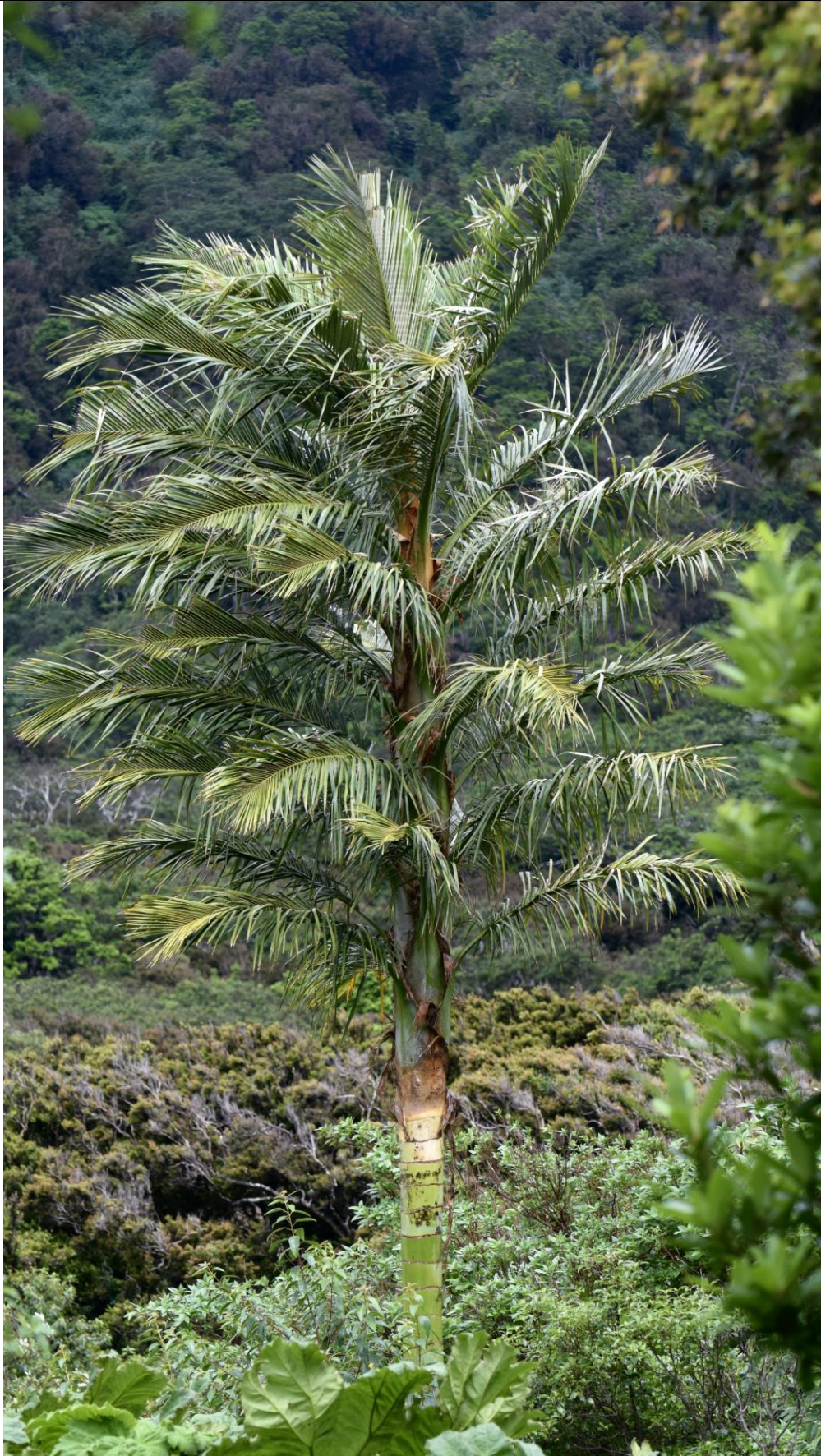
Juania australis , individuo solitario.