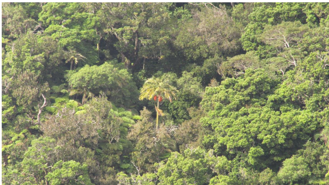
Juania australis emergiendo entre la mirtisilva de Robinson Crusoe.