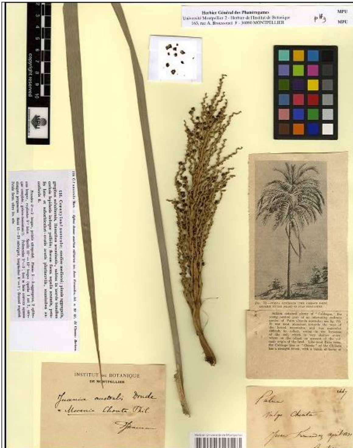
Muestra de herbario de Juania australis : Isotipo y etiqueta del espécimen de herbario depositado en el Herbar de l'Universite Montpellier II (MPU), MPU014243, Francia.