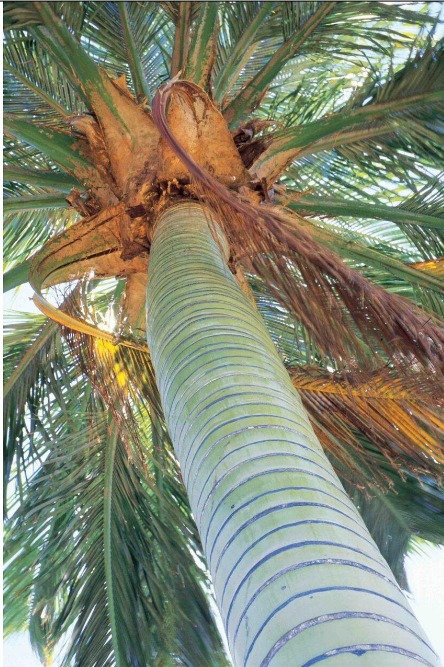
Juania australis , detalle del estípite y la inserción de las hojas.