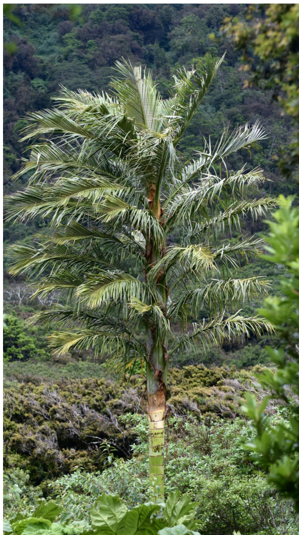
Juania australis , individuo solitario.