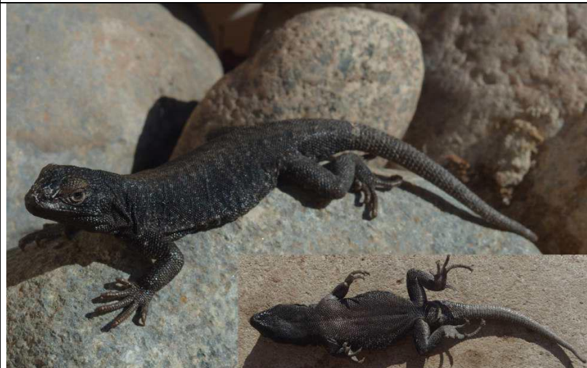
Vista dorsal y ventral del neotipo (macho FML 29867) de Liolaemus andinus . (Abdala et al., 2021)