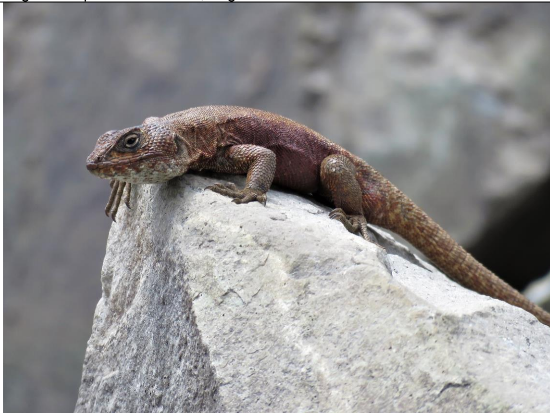
Liolaemus normae

Lagarto leopardo de Norma, Lagarto de los cristales