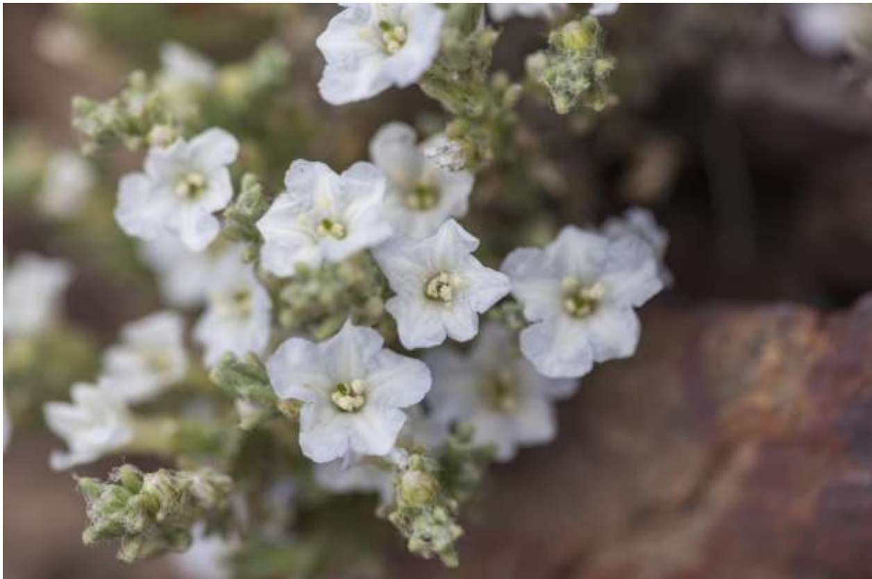
Figura 3. Registro de Nolana diffusa obtenido en febrero del 2010 en la Región de Antofagasta, Chile.