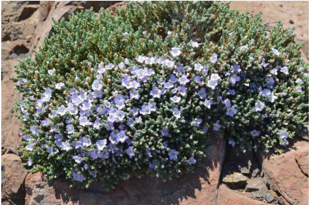
Figura 2. Registro de Nolana diffusa obtenido en octubre del 2019 en la Reserva Nacional La Chimba, Región de Antofagasta, Chile.