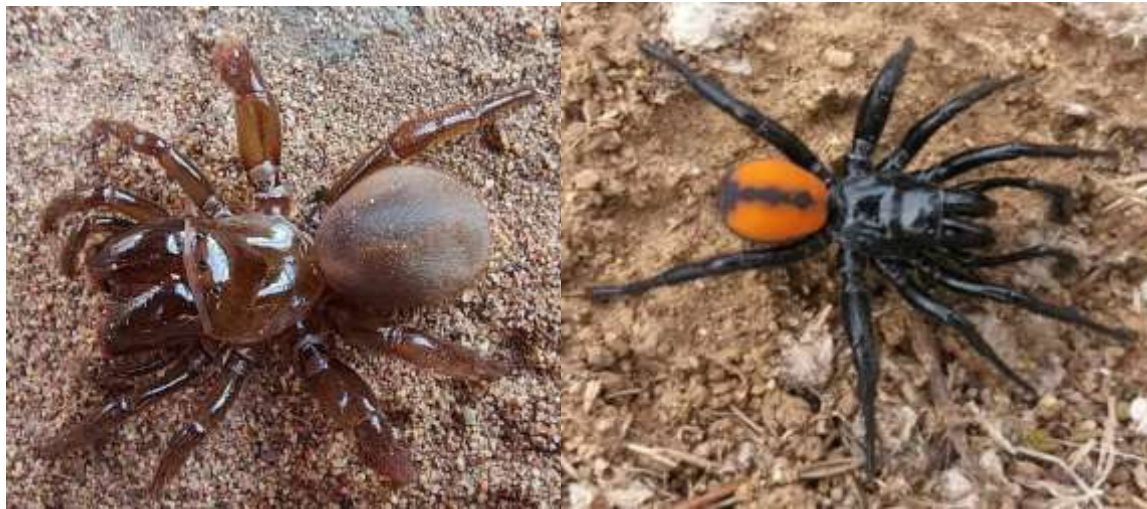
Plesiolena bonneti : hembra (izquierda), macho (derecha),