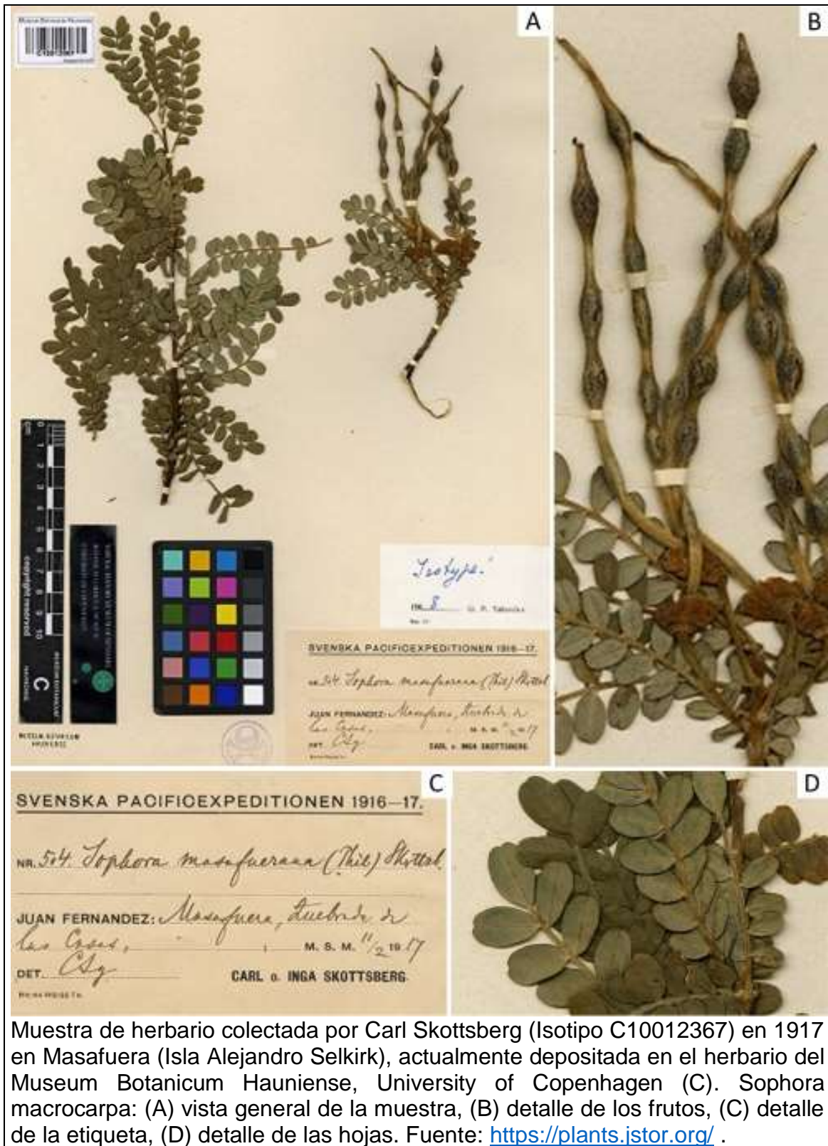
Muestra de herbario colectada por Carl Skottsberg (Isotipo C10012367) en 1917 en Masafuera (Isla Alejandro Selkirk), actualmente depositada en el herbario del Museum Botanicum Hauniense, University of Copenhagen (C). Sophora macrocarpa : (A) vista general de la muestra, (B) detalle de los frutos, (C) detalle de la etiqueta, (D) detalle de las hojas.