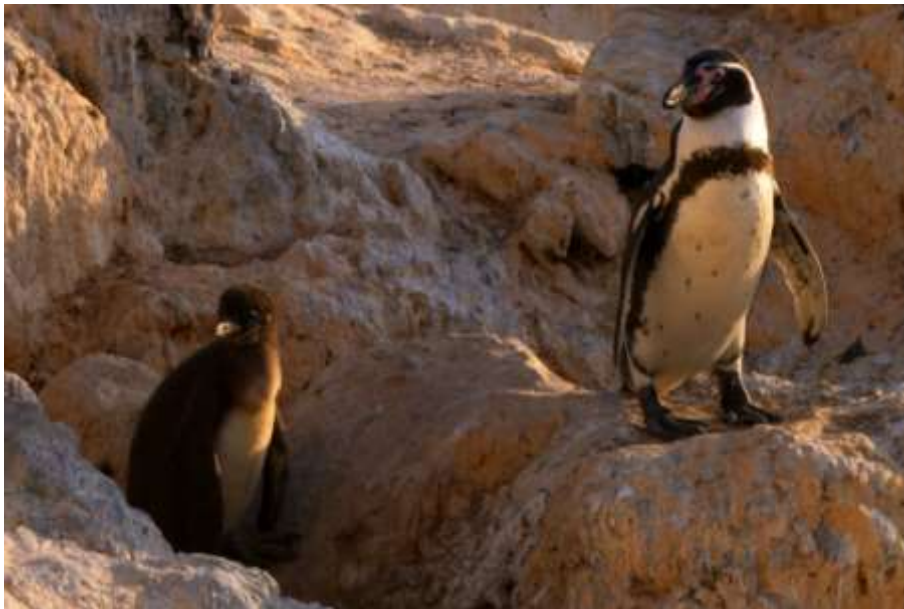
Fotografía: Adulto de pingüino de Humboldt y polluelo en Islote Blanco. Taltal, Región de Antofagasta, Autor: Diego Sepúlveda // Autorizada para sitio web.

Pingüino de Humboldt, pingüino, pájaro niño, patranka. Humboldt Penguin (inglés), Peruvian Penguin (inglés).