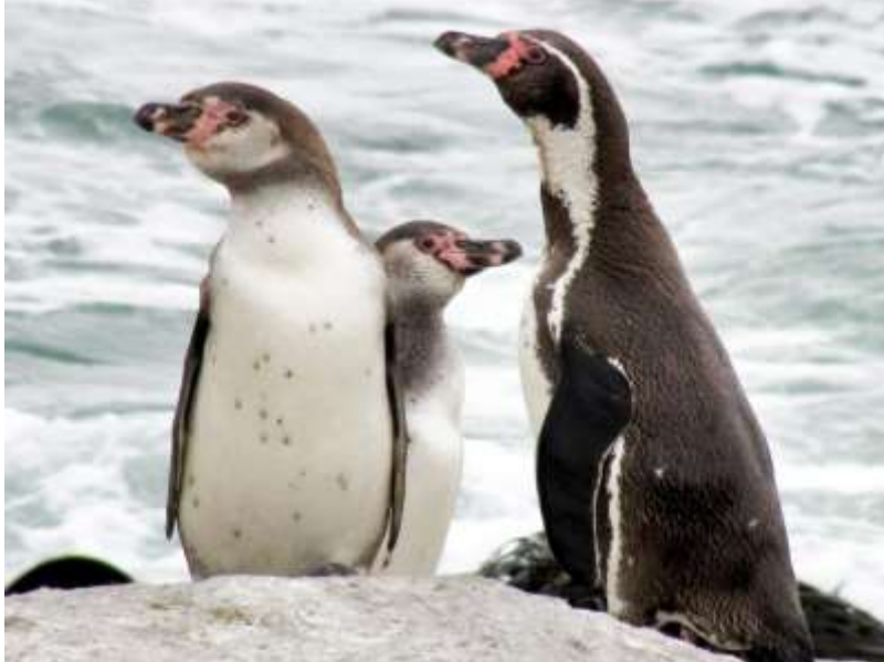
Fotografía: Adulto y juveniles de pingüino de Humboldt en S. N. Islote Pájaro, Algarrobo. Autor: Maximiliano Daigre. // Autorizada para sitio web.