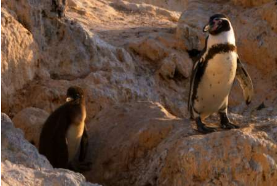
Fotografía: Adulto de pingüino de Humboldt y polluelo en Islote Blanco. Taltal, Región de Antofagasta, Autor: Diego Sepúlveda // Autorizada para sitio web.