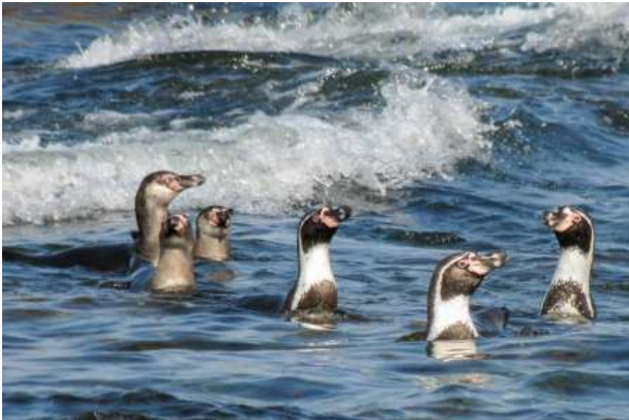
Fotografía: Adulto y juveniles de pingüino de Humboldt en S. N. Islote Pájaro, Algarrobo. Autor: Maximiliano Daigre. // Autorizada para sitio web.