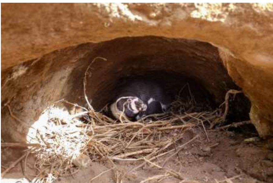
Fotografía: Adulto de pingüino de Humboldt en nido, M. N. Isla Cachagua, Zapallar. Autor: Maximiliano Daigre. // Autorizada para sitio web.