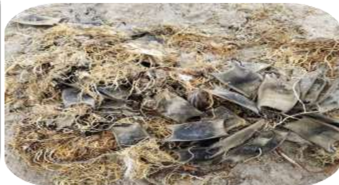
Cápsulas de Sympterygia brevicaudata varadas en Playa Changa, Coquimbo en diciembre de 2022.