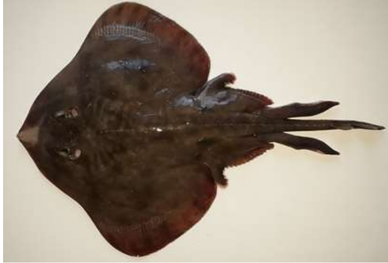
Sympterygia brevicaudata adulto, vista dorsal