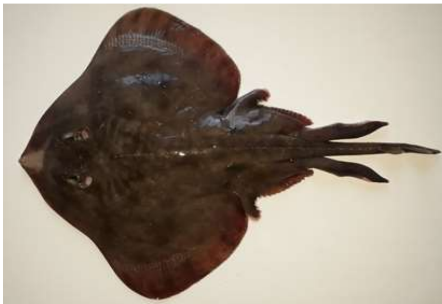
Sympterygia brevicaudata adulto, vista dorsal