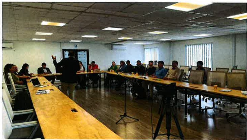
Imagen 2. Sesión CORECC- participantes Online, martes 23 de diciembre 2025